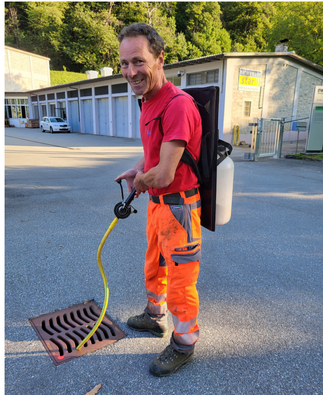
Il granulato larvicida viene immesso nei tombini

Dal monitoraggio risulta che la presenza di uova di zanzara tigre dal 2017 al 2023 è costante; un insediamento vero e proprio fino all'anno scorso non può però essere confermato. Si parla di colonia di zanzare insediate se una trappola risulta positiva in tre giri di controllo consecutivi.